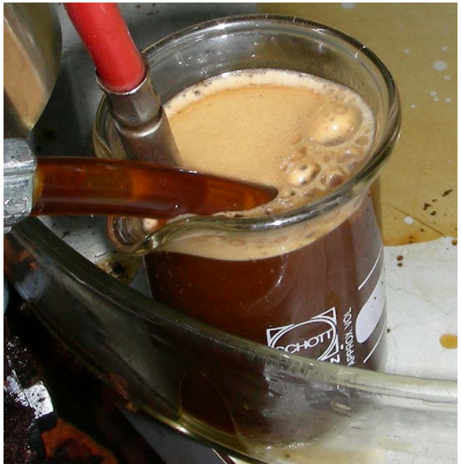
Abbildung 1: Kaffee mit Crema